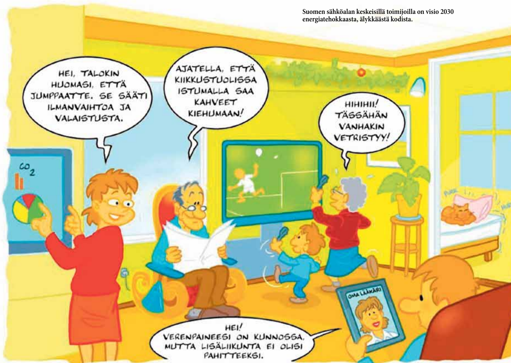
Suomen sähköalan keskeisillä toimijoilla on visio 2030 energiatehokkaasta, älykkäästä kodista.

Taloautomaatiikan järjestelmien johtavaa asemaa pitää KNX. Kirjaimet tarkoittavat englannin kielen sanoja liitettävyys, kytkettävyys ja yhteensopivuus. Yksittäisten valmis-