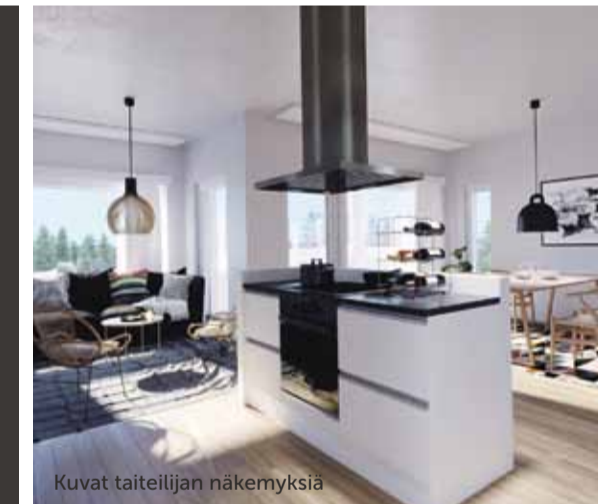
Kuvat taiteilijan näkemyksiä

ESITTELYT PE 8.2. klo 9.00 - 16.00 LA 9.2. klo 11.00 - 14.00 SU 10.2. klo 11.00 - 14.00 Toimistollamme Maaherrankatu 10