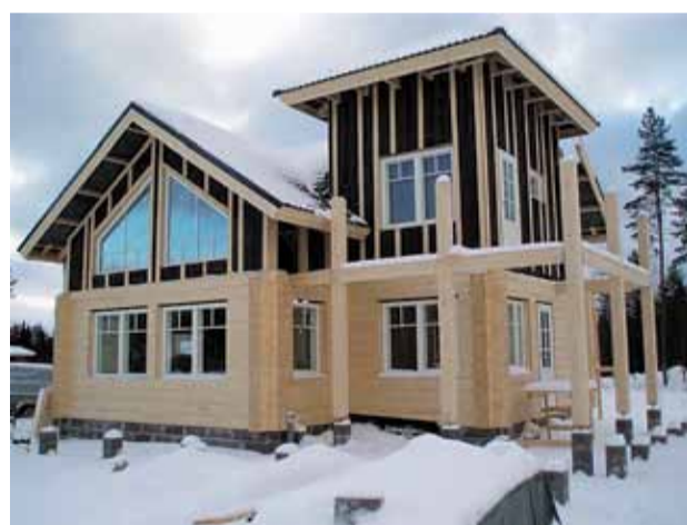
Hirsitalon rakentaminen myös talviaikaan onnistuu oikein hyvin.

Vaikka perustustyö kuuluisikin pakkettiin, se tarkoittaa vain standardiperustusta. Paaluttaminen tai leveä antura nostavat heti hintaa. Selvitä myös, estävätkö kaavamääräykset pakkettitalon pystyttäminen, ja millaisia vaatimuksia kun-